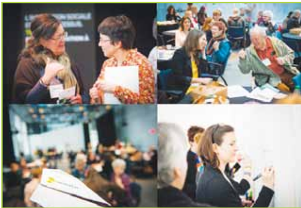
Le Grand ralliement - Trajectoire

Intention : que les participants s'approprient le concept d'innovation sociale et son potentiel pour leur organisme et pour le milieu communautaire des aînés, dans un contexte d'expérimentation et de partage d'expertises.