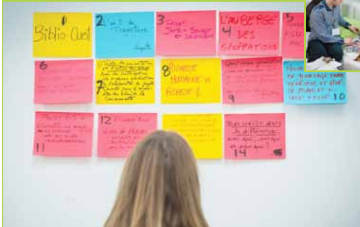
Café pro-action Le Grand ralliement - Trajectoire