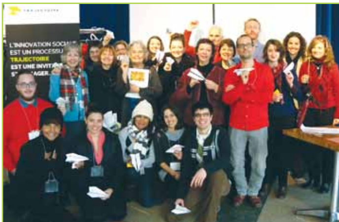
Voici une partie des complices du premier rassemblement de Trajectoire! Forum ouvert - Trajectoire

Une rencontre participative et créative où les participants dictent l'ordre du jour et les questions à aborder sur le thème commun de réflexion suivant : Le plurigénérationnel : une clause vitale du contrat social de demain.