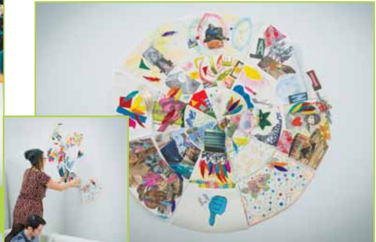
Remue-mémoire artistique Le Grand ralliement - Trajectoire