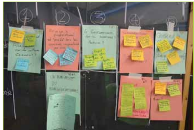
Le plurigénérationnel : une clause vitale du contrat social de demain? Forum ouvert - Trajectoire