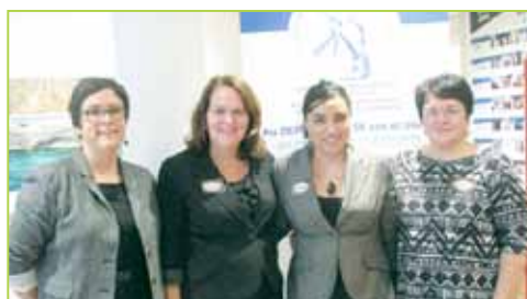
Forum L'Âgisme au menu Le Centre du Vieux Moulin de LaSalle