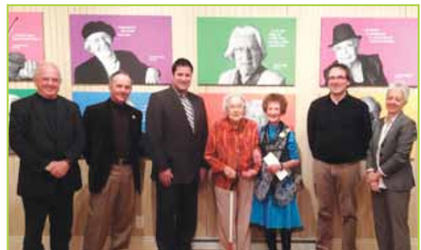
Visâges et Témoignâges Les Petits Frères