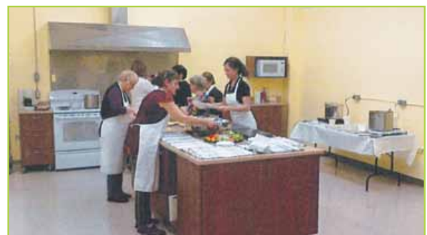
Cuisine nouvellement aménagée Cuisine collective des Îles-de-la-Madeleine

« À venir : procéder à l'évaluation du Fonds PRÉSÂGES à l'aide du cadre élaboré à cette fin. »