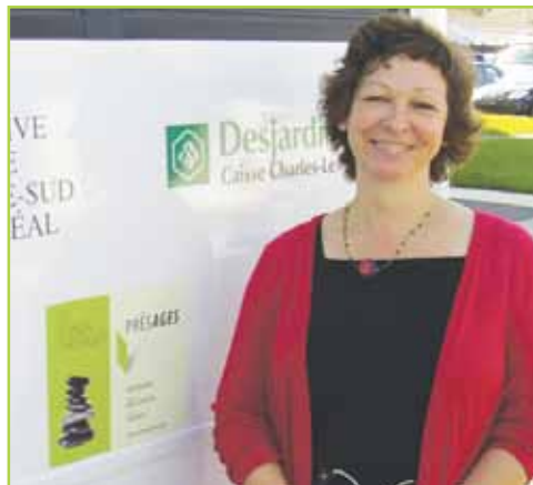
Achat d'un minibus Maison des Tournesols